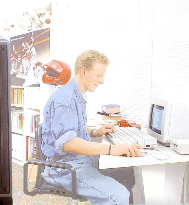
Abbildung: ATARI 520 ST ™ mit Maus, ATARI Floppy SF 314 mit 720 KB formatiert und handelsüblichem Fernsehgerät.